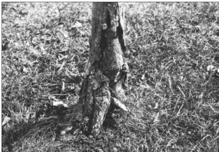
Les coupe-gazon et les tondeuses à gazon peuvent endommager l'écorce et le cambium des arbres.

L'utilisation peu attentive de tondeuses à gazon, de tondeuses à fil et d'autre équipement peut endommager les troncs des arbres. Certains corsets d'arbre réduisent ces risques en protégeant les arbres contre l'abrasion et en les rendant plus visibles.