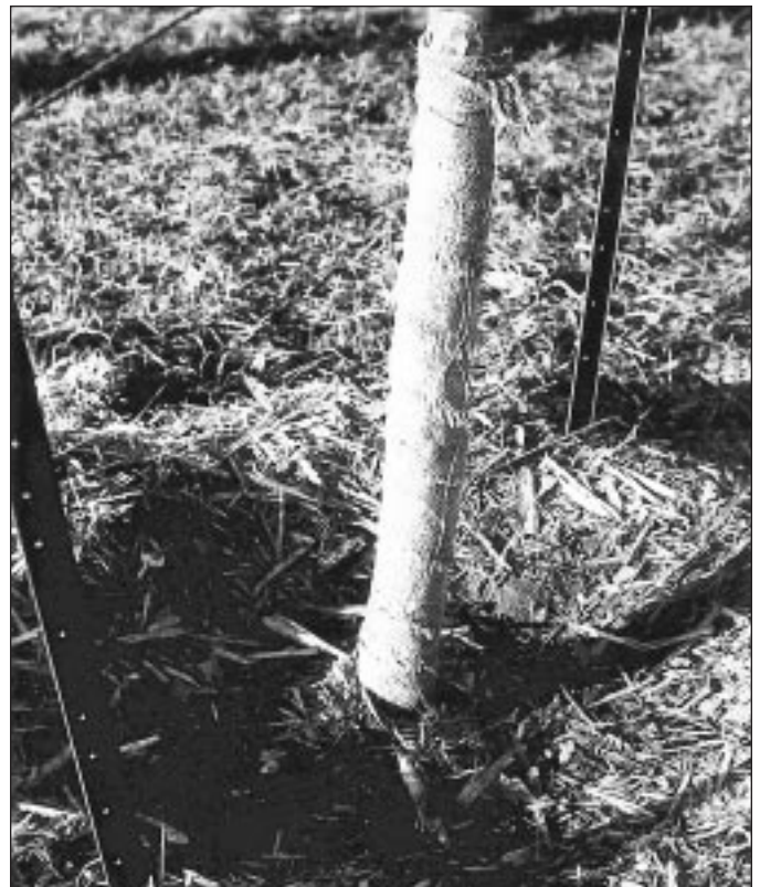
De la toile de jute attachée de manière lâche avec de la corde protège les arbres contre les températures extrêmes.

De la toile de jute attachée de manière lâche avec de la corde autour des arbres protège ceux-ci contre les températures extrêmes. Elle ne les protège toutefois pas contre les animaux et l'équipement. Ajustez la corde chaque année pour qu'elle ne soit pas trop serrée autour de l'arbre.