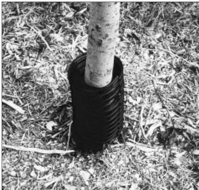
Les tuyaux de drainage protègent les arbres contre les températures extrêmes, les petits mammifères et l'équipement. Utilisez de préférence les tuyaux blancs plutôt que les noirs.

Remarque : Des noms commerciaux de produits sont signalés pour faciliter la tâche des lecteurs mais ceci ne veut pas dire que le ministère des Richesses naturelles recommande certains produits plutôt que d'autres.