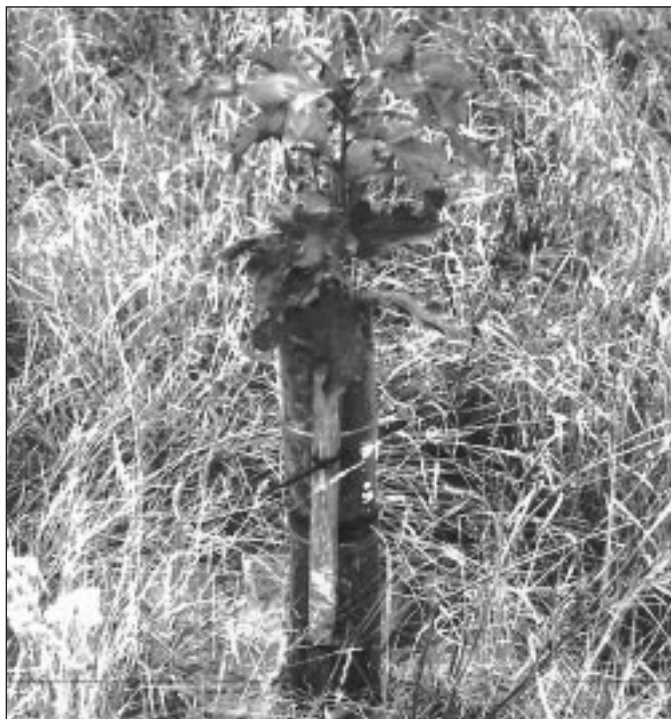
Quatre bouteilles à boisson gazeuse empilées les unes sur les autres protègent les gaules contre les températures extrêmes, les petits mammifères et l'équipement.

Réalisé par le Centre de ressources pour propriétaires fonciers en collaboration avec le ministère des Richesses naturelles de l'Ontario et la Forêt modèle de l'Est de l'Ontario.