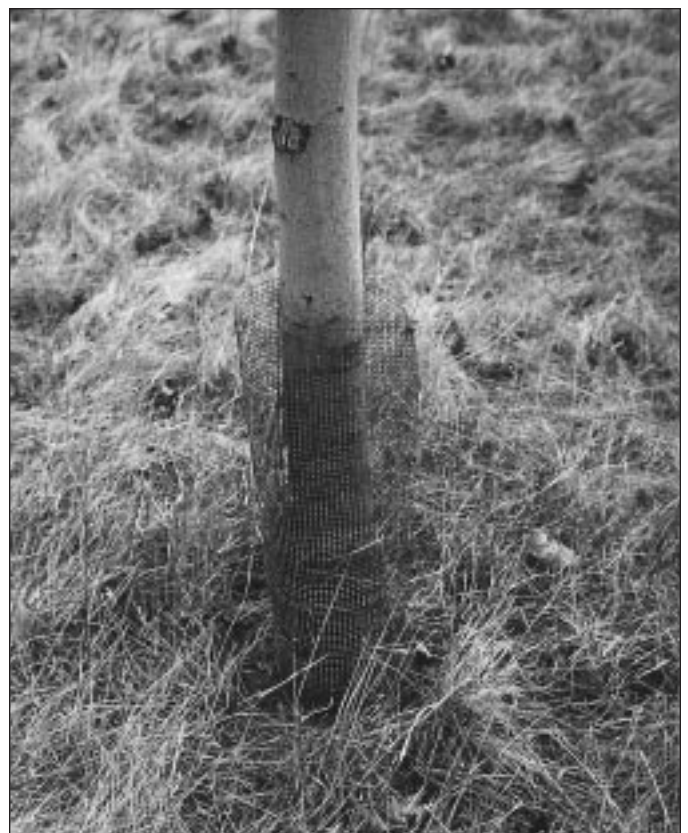
Le grillage métallique protège les arbres contre les campagnols et autres petits mammifères.