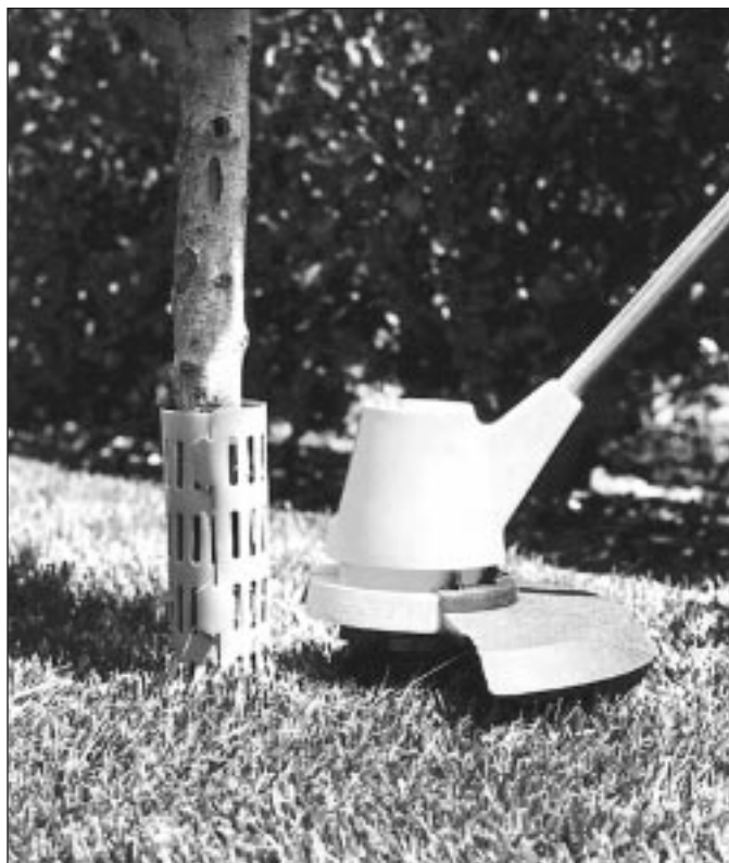
Les corsets ArborGard s'agrandissent lorsque les arbres grossissent et les trous d'aération intégrés empêchent l'humidité de s'accumuler.